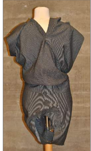
Kombinasjon mellom fleire plagg