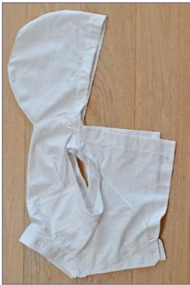
Justering av hette og krage